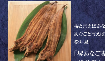
堺と言えばあなご、あなごと言えば松井泉 「堺あなご専門 松井泉」