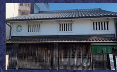
お茶文化のバイオニア「つば市製茶本舗」