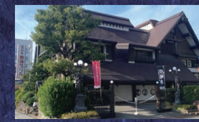
日本の宮崎牛「ピフテキの南海グリル」