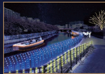
★環濠ナイトクルーズ 17:00~21:00 受付16:30~20:30最終運航

開催場所 内川・土居川河川敷、ザビエル公園 開催日時 令和3年12月4日(土)~令和4年1月15日(土) 17:00~23:30