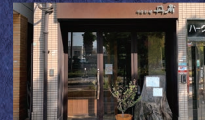
予約のとれない人気店「中国料理 丹甫」