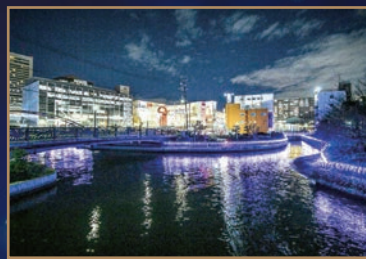
★イルミネーション 17:00~23:30

医療従事者への感謝やコロナ収束への祈りを表現したブルーライト、未来への希望を表現したシャンパンゴールド、2色のイルミネーションで環濠の川面を照らします。ザビエル公園では、ふとん太鼓や注染日傘のライトアップ、堺ならではの光のモチーフなどで、堺まつりのレガシーや堺の歴史を表現します。川面から環濠の夜景を楽しめるナイトクルーズ、堺の名店が出店するナイトマルシェなどを楽しみながら夜のまちを散歩するのはいかがでしょうか。