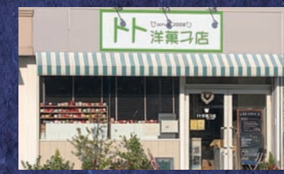
堺ならではのかわいいお菓子「ト洋菓子店」