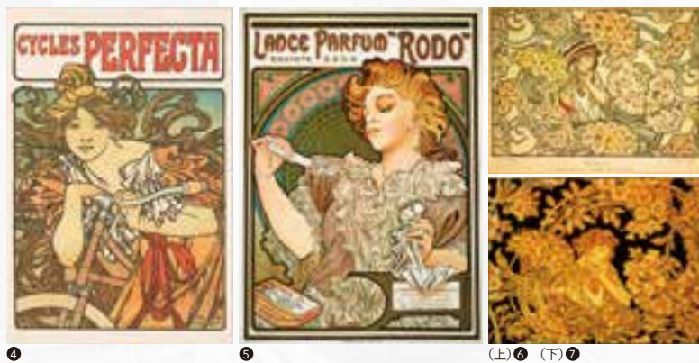
① ボール・ベルトン『ポスターの巨匠たち』(1895年版) 1896年 紙に印刷 ② ジュール・シュレ『タバコ巻紙「ジョブ」』『ポスターの巨匠たち』より 1895年 リトグラフ、紙 ③ 『レスタンプ・モデルヌ』誌表紙(第15号) 1898年 リトグラフ、紙(雑誌) ④ ランスの香水「ロド」 1896年 リトグラフ、紙 ⑤ 『ビザンティン: ミュシャの壁布プロジェクト』1900年頃 リトグラフ、紙 ⑥ 『ビザンティン: 壁布』1900年頃 ベルベットに印刷 ⑦ 『カッサン・フィス印刷所』部分 1896年 リトグラフ、紙 上記 ⑧-⑨ アルフォンス・ミュシャ作 ⑩-⑪ 堺 アルフォンス・ミュシャ館(堺市)蔵

ポスター人気を機に室内装飾や日用品、工芸や宝飾の分野からのミュシャ・スタイル需要にも応えたミュシャ。大衆のための芸術を目指し、名実ともにパリのトップ・デザイナーとして活躍したミュシャのデザイン業にせまります。